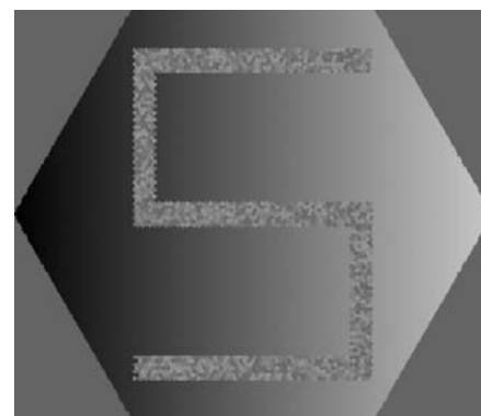
Fig.3. Ejemplo de variación local en una imagen. La imagen del 5 es difícilmente segmentable utilizando los valores de intensidad de forma global.

vector, podemos utilizar técnicas de agrupamiento de vectores (clustering) para definir las clases tales como k-medias, k-medias difusas, mapas autoorganizativos, división de grafos, etc. Un inconveniente habitual en todas estas técnicas de agrupamiento es que el usuario debe indicar el número de clases en las que quiere dividir la imagen (en el ejemplo central de la Fig.1 serían tres clases: núcleo, citoplasma, y fondo). Si se dispone de un conjunto de imágenes de entrenamiento, entonces se pueden emplear técnicas de clasificación de vectores en lugar de clustering. Entre estas técnicas figurarían las redes neuronales, las redes bayesianas, el análisis discriminante, las máquinas de vectores de soporte ( Support Vector Machines ), etc.